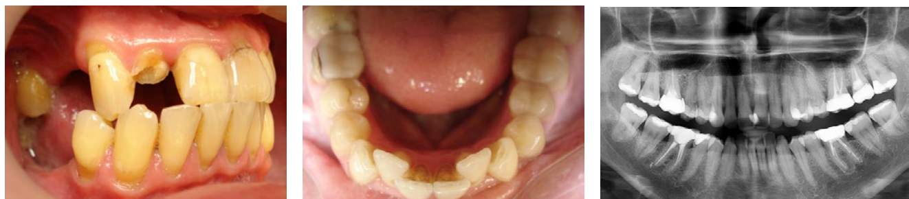
Рис. 3. А — состояние полости рта пациента А., 1963 г. р.; В — состояние полости рта пациентки Н., 1977 г. р.; С — фрагмент ортопантограммы той же пациентки

что отражено на диаграмме (рис. 1). Распространенность кариеса зубов у обследуемых пациентов высокая (100%). У всех больных выявлен очень высокий уровень интенсивности кариеса. Среднее значение КПУ зубов составило 18,44 \pm 5,5 . Этот показатель значительно превышает аналогичный в целом по России — 12,3 единицы [4]. В структуре индекса КПУ зубов преобладает компонент «П», причем у женщин он в 2 раза выше, чем у мужчин. Это подтверждает тот факт, что женщины чаще посещают стоматолога по поводу лечения кариеса и его осложнений. У мужчин преобладает компонент «У», это подтверждает то, что мужчины чаще обращаются за стоматологической помощью по поводу удаления зубов.