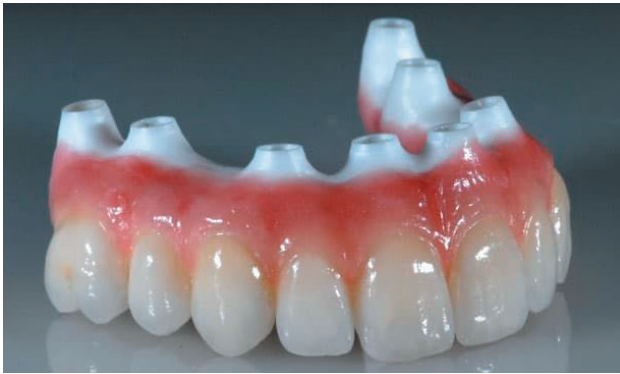
Рис. 3. Протез с фрезерованными основаниями из диоксида циркония Fig. 3. Prosthesis with milled bases made of zirconium dioxide

Отказ от использования цементной фиксации в ортопедическом протоколе позволяет значительно снизить риск развития осложнений, связанных с остатками фиксирующего материала в зоне имплантата [11]. Цемент, даже в минимальных количествах, может проникать в поддесневое пространство, где его полное удаление затруднено, что создает условия для микробной колонизации и хронического воспалительного процесса. Накопление остаточного цемента вокруг имплантата является одной из признанных причин развития периимплантита, сопровождающегося потерей костной ткани и нарушением стабильности имплантата [11]. Применение альтернативных методов фиксации, в частности замена титанового основания на фрезерованное из диоксида циркония, позволяет исключить данный патогенетический фактор, обеспечивая контролируемость процесса установки и улучшая биосовместимость реставрации с окружающими мягкими тканями [6].