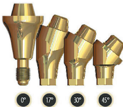
Рис. 1. Мультиюниты: прямой и с разными углами наклона Fig. 1. Multi-units: straight and with different angles of inclination

Существуют разные типы абатмент-мультиюнит. Исходя из клинических условий, в зависимости от степени углубления имплантата в кости подбирают размер и угол выхода технической шахты винта относительно анатомии коронки, он бывает от 0 до 45 градусов (рис. 1).