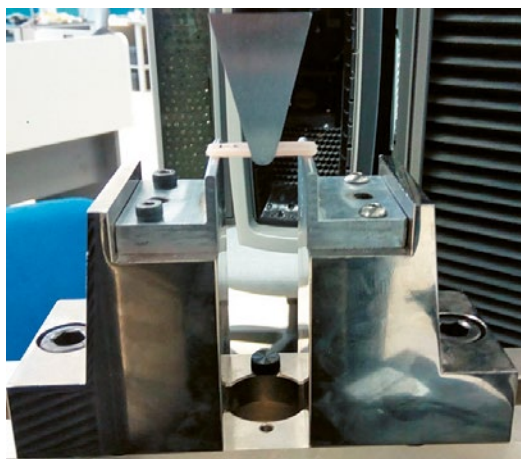
Рис. 1. Образец перед испытанием на трехточечный изгиб при комнатной температуре

На базе ЦКП Центра экспериментальной механики ПНИПУ, на универсальной электромеханической системе Instron 5965 с центральным нагружающим индентором и двумя опорами в виде цилиндров диаметром 3,2 мм проводились испытания на статический трехточечный изгиб при комнатной температуре (22 °C) до значения прогиба в 7 мм. Расстояние между центрами опор было принято 25 мм, скорость нагружения составляла 5 мм/мин. Вид образца перед испытанием показан на рис. 1.