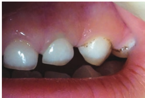
Рис. 8. Состояние десны после чистки Pro-Cup зуба 6.2