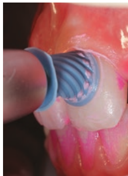
Рис. 7. Щадящая чистка чашечкой Pro-Cup