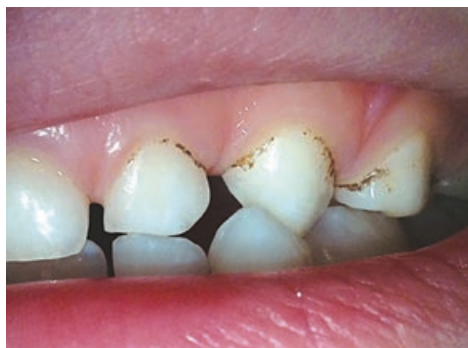
Рис. 6. Типичная картина налета Присли у детей