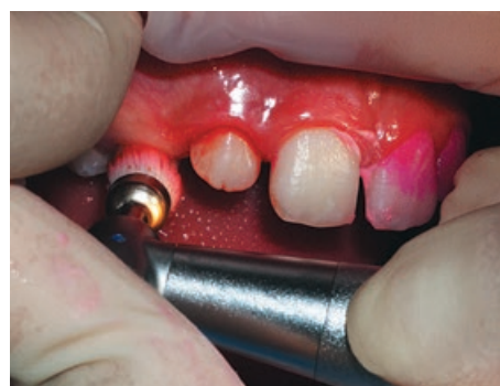
Рис. 5. Кровотечение из десны в процессе обучения гигиене полости рта

действительно может быть болезненной и производить неприятное впечатление как на ребенка, так и на родителей.