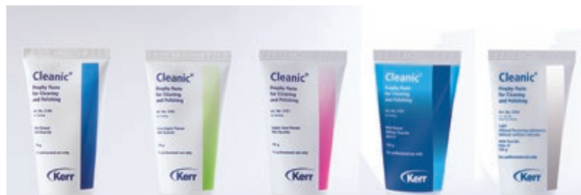
Рис. 2. Пасты Cleanic: со вкусом мяты, зеленого яблока, жевательной резинки, Cleanic Light