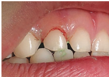
Рис. 9. Кровотечение после проведения профессиональной чистки обычной полировочной щеткой зуба 5.2 у того же пациента

и идеально подходит для проведения профессиональной гигиены полости рта у детей. Особый состав материала чашечки препятствует нагреванию зуба. Чашечки не содержат латекса, что способствует снижению риска появления аллергии. Благодаря оптимизированной форме край чашечки аккуратно заходит под десну (рис. 7), значительно снижая вероятность травмирования слизистой и обеспечивая отсутствие кровотечения после проведения чистки (рис. 8 и 9). Это позволяет проводить реставрацию в одно посещение с чисткой зубов. В случаях, когда планируется совместить проведение чистки и реставрации, рекомендуется использовать пасту Cleanic Mint Fluoride-Free, не содержащей фторид (рис. 2, синяя туба) в связи с тем, что использование перед реставрацией фторсодержащих паст может негативно сказаться на качестве реставрации, так как происходит химическая реакция фтора с адгезивными системами.