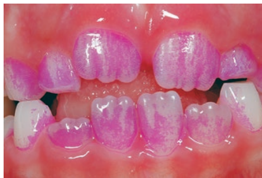
Рис. 1. Демонстрация налета при помощи индикатора

Ситуация еще более усложняется при наличии налета Присли (рис. 6), когда процедура чистки