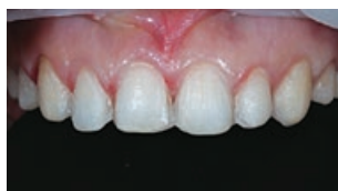
Рис. 19. Препарирование зубов в пределах эмали