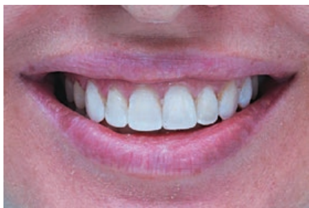
Рис. 18. Оценка зоны улыбки и проведение фонетических проб