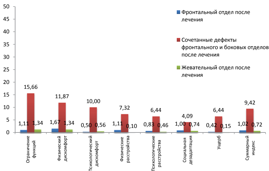
Рис. 2. Среднее процентное значение снижения параметров качества жизни согласно отдельным тематическим блокам опросника ОНIP-49 в трех исследуемых группах после лечения