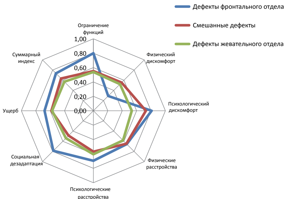
Рис. 3. Относительная эффективность лечения по Cohen (1976).

Значения показателя Cohen: < 0,2 – малозначимый эффект проведенной терапии, 0,2–0,8 – умеренный эффект проведенной терапии, > 0,8 – выраженный эффект проведенной терапии