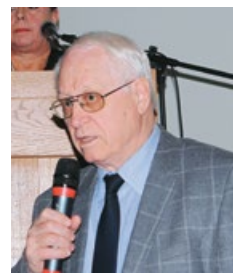
Итоги доклада по новым лекарственным препаратам в стоматологии подводит академик Чупахин О.Н.