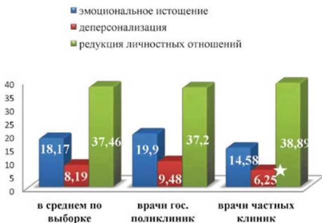
Рис. 3. Выраженность СЭВ стоматологов-терапевтов в зависимости от формы организации лечебного учреждения (примечание: различие по сравнению с показателями врачей гос. поликлиник статистически значимо, p < 0,05 )

Выраженность СЭВ в различных группах врачей по стажу работы показала, что самые высокие показатели по шкалам методики МВИ ЕЕ и РА обнаружались у стоматологов со средним стажем 11-15 лет, а по шкале DP – в группе со средним стажем до 5 лет ( p > 0,05 ; рис. 2). Наименьшие показатели по шкале ЕЕ и DP наблюдались в группе со средним стажем от 21 года, по шкале РА – в группе со средним стажем до 5 лет ( p > 0,05 ; рис. 2). Некоторую степень эмоционального истощения ученые считают нормальным возрастным изменением, а определенный уровень деперсонализации – необходимым механизмом психологической защиты для целого ряда социальных (или коммуникативных) профессий в процессе профессиональной адаптации. Начальный период профессиональной адаптации неизбежно связан