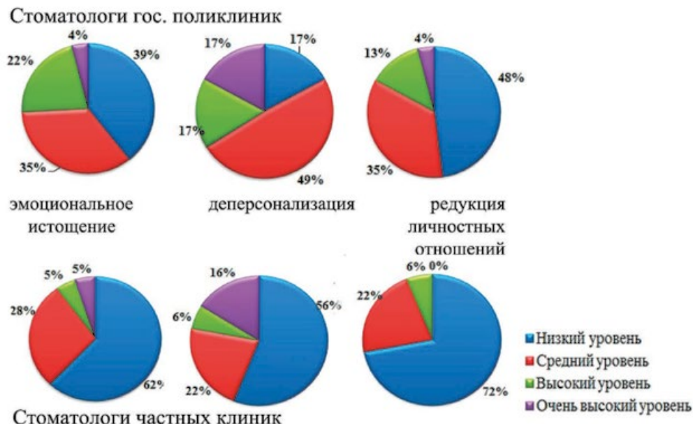
Рис. 4. Различия в процентном соотношении уровней СЭВ по шкалам EE, DP и PA у врачей частных и государственных клиник