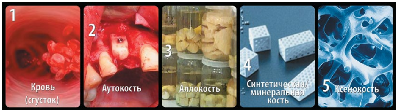
Рис. 1. Рейтинг клинической остеогенной эффективности изолированно используемых материалов

вратимо меняет наше рабочее место и саму нашу работу, так же как время незаметно меняет наши лица и улицы наших городов. Однако без рук и интеллекта врача ни одна технология не работает.