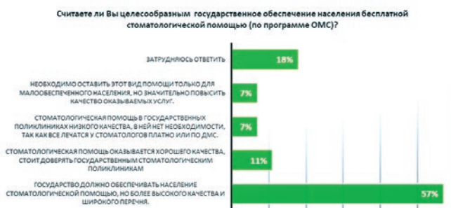
Рис. 7. Мнение респондентов относительно государственного обеспечения населения бесплатной стоматологической помощью (по программе ОМС)