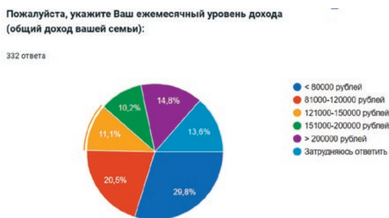
Рис. 1. Оценка респондентами своего ежемесячного семейного совокупного дохода

По данным Росстата, наиболее распространены семьи со средним и низким доходом [14]. 130 (39,2%) респондентов регулярно посещают стоматолога для проведения профилактического осмотра, а 48 участников (14,5%) в настоящее время находятся на стоматологическом лечении. Стоит обратить внимание на то, что 26,5% опрошенных (88 человек) посещают