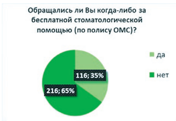
Рис. 5. Обращаемость за стоматологическими услугами в рамках программы ОМС

Особую роль в доступности качественной современной стоматологической помощи играет экономический фактор. Одним из решений этой проблемы является возможность софинансирования расходов. В целом, 73% среди участников опроса готовы рассмотреть вариант распределения расходов на стоматологические услуги в виде соплатежей (рис. 8). Стоит