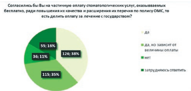
Рис. 8. Мнение респондентов относительно софинансирования стоматологической помощи совместно с государством