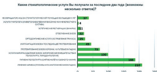
Рис. 4. Наиболее востребованные стоматологические услуги среди опрошенных

Один из ключевых вопросов, влияющих на оценку, касался полноты перечня стоматологических услуг, предусмотренных государственной системой обязательного страхования (рис. 4). Здесь мы предложили участникам выбрать несколько вариантов ответа: какого характера услуги они получали в течение последних двух лет. Большому количеству респондентов пришлось сталкиваться с лечением кариеса (210 оценок), проводить стоматологические профилактические мероприятия (188 оценок). Относительно других видов стоматологических услуг структура оценок следующая: услуги протезирования — 73 оценки, имплантация