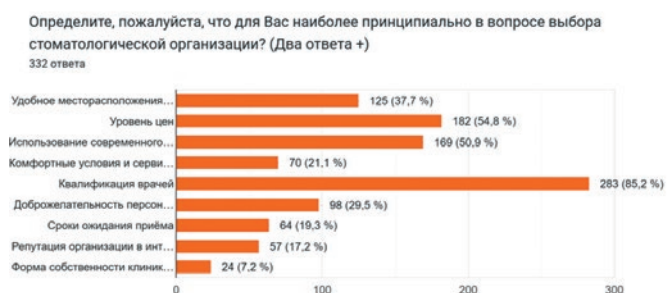
Рис. 3. Критерии выбора пациентами стоматологической организации