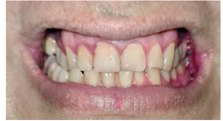
Рис. 4. Индикация налета через 4 недели исследования с использованием спрея для профилактики кариеса «ДентаБаланс®» синбиотический комплекс (Пациент Б)