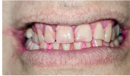
Рис. 3. Индикация налета через 2 недели исследования с использованием спрея для профилактики кариеса «ДентаБаланс®» синбиотический комплекс в день осмотра (Пациент Б)