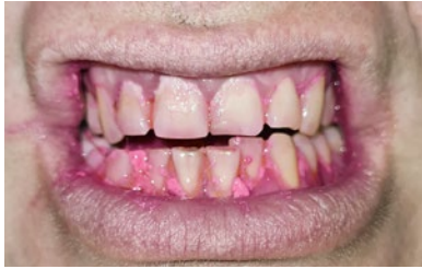
Рис. 2. Индикация налета в начале исследования до использования спрея для профилактики кариеса «ДентаБаланс®» синбиотический комплекс в первый день (Пациент Б)