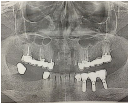
Рис. 1. ОПТГ пациентки А., 45 лет.