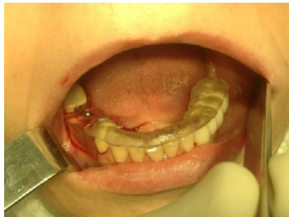
Рис. 3. Наложен хирургический шаблон и проведено пилотное сверление

Рекомендованы длины сверления в области отсутствующего зуба 4.5 — 22 мм, 4.7 — 20 мм