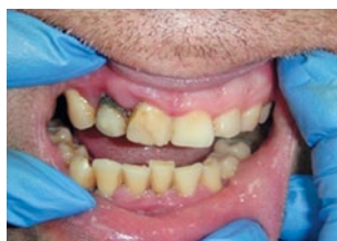
Рис. 2. Пациент после склерозирующей терапии и терапевтического лечения Fig. 2. Patient after sclerotherapy and therapeutic treatment