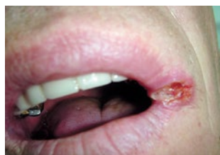
Рис. 3. Фиксированный герпес в углу рта Fig. 3. Fixed cold sores in the corner of the mouth