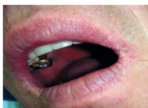
Рис. 5. Фиксированный герпес в углу рта на стадии эпителизации Fig. 5. Fixed herpes in the corner of the mouth at the epithelialization stage

Цель — оценить эффективность введения в традиционную схему лечения пациентов с патологией органов полости рта препаратов группы нейролептиков последнего поколения.