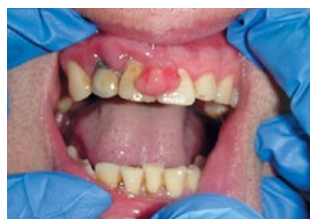
Рис. 1. Гипертрофия межзубного сосочка в области центральных резцов Fig. 1. Hypertrophy of the interdental papilla in the region of central incisors

В современной стоматологии все больше прослеживается тенденция в диагностике нозологических депрессий у пациентов с заболеваниями органов полости рта. Таким образом, исследование фонового психического состояния и отработка методов психокорректирующего вмешательства при заболеваниях слизистой оболочки полости рта весьма актуальны [24—25].