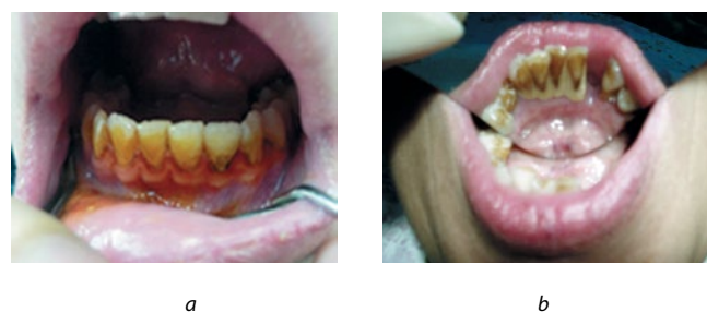
Fig. 1. Clinical picture of smokers:

MS sampling was carried out twice: in smokers — before and 15 minutes after smoking, in non-smokers — for reliability of research — initially and after 15 minutes