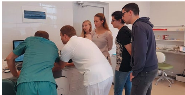
Рис. 4. Посещение клиники и зуботехнической лаборатории «Витал ЕВВ» Fig. 4. Visiting clinic and dental laboratory «Vital EVV»