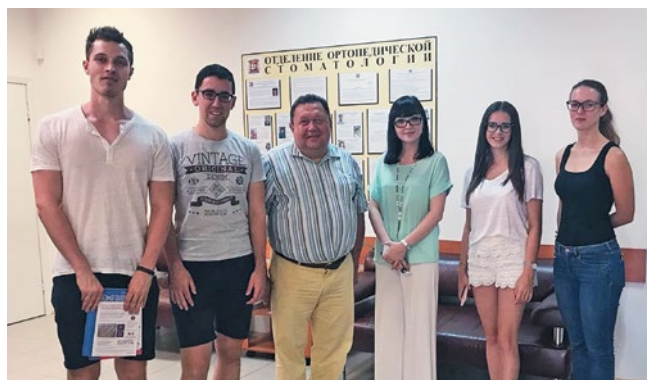
Рис.5. Посещение кафедры ортопедической стоматологии и стоматологии общей практики Fig. 5. Visit to the department of orthopedic dentistry and general practice dentistry