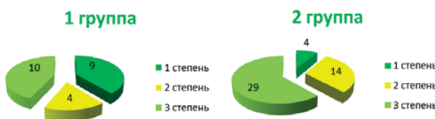
Рис. 4. Распределение степеней гиперестезии у пациентов обеих групп.