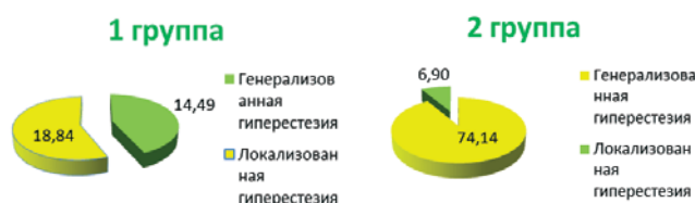
Рис. 3. Частота генерализованной и локализованной гиперестезии у пациентов обеих групп.