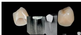
Рис. 5. Постоянная коронка с анатомически адаптированным краевым профилем Fig. 5. Permanent crown with anatomically adapted marginal profile

установлен диагноз: хронический генерализованный пародонтит средней степени тяжести в стадии обострения, осложненный продольной трещиной зуба 3.4