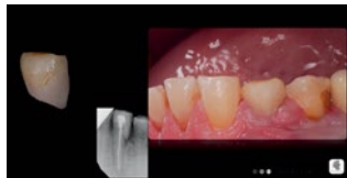
Рис. 3. Временная коронка и клиническая картина после фиксации Fig. 3. Temporary crown and clinical situation after fixation