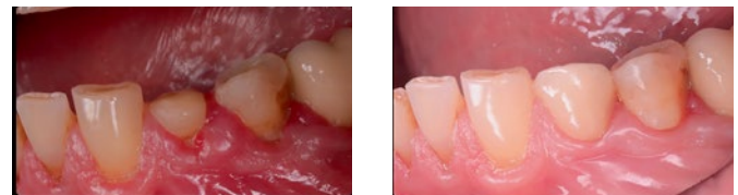
Рис. 6. Клиническая ситуация до и после проведенного лечения Fig. 6. Clinical situation before and after treatment

Химический профиль гидролата по результатам хромато-масс-спектрометрии, в составе гидролата лавра определены высокоактивные компоненты: эвкалиптол, \alpha -терпинеол, терпинен-4-ол — соединения