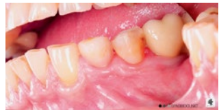
Рис. 4. Вид мягких тканей спустя 10 дней после фиксации временной коронки Fig. 4. Soft tissue on the 10th day after temporary crown fixation