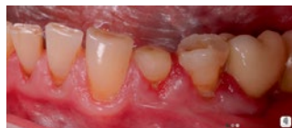
Рис. 2. Клиническая картина на 5 сутки после применения гидролата лавра Fig. 2. Clinical case on the 5th day after application of laurel hydrogel