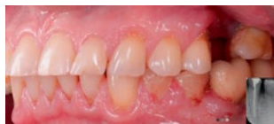
Рис. 1. Клиническая ситуация исходная Fig. 1. Initial clinical situation