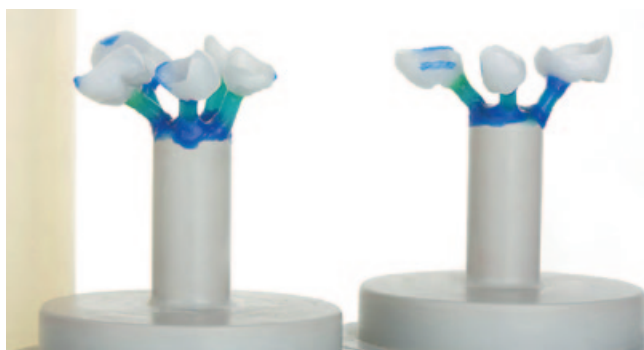
Рис. 6. Литьевое прессование керамики