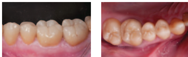
Рис. 10 и 11. Керамические коронки полости рта после фиксации