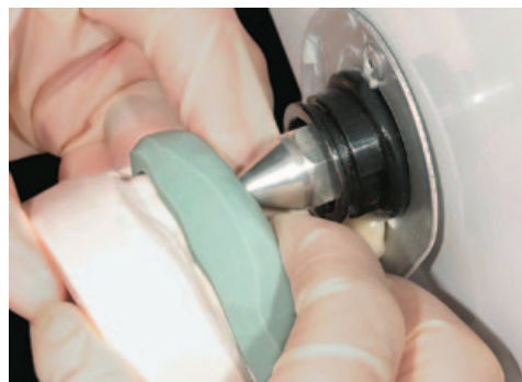
Рис. 2. Дублирование горячим воском