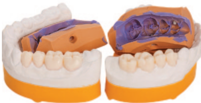
Рис. 3. Восковая моделировка на рабочей модели после дублирования