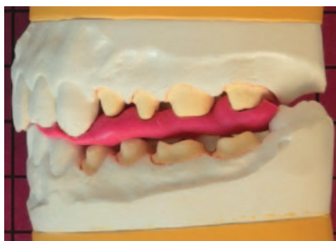
Рис. 1. Рабочая модель

Методика позволяет повторить форму восковой реставрации на другой (рабочей модели) (рис. 3). Использование дублированной таким способом восковой моделировки для прессовки керамической реставрации показывает неудовлетворительный результат, так как цементный зазор получается слишком широким. Чтобы обеспечить точное соответствие реставрации культе зуба, нами проводится раздельное сканирование (сканер «3Shape 810») культей и воскового моделирования, с последующим совмещением сканов программным способом (рис. 4).