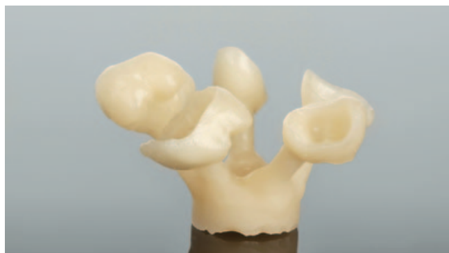
Рис. 7. Литьевое прессование керамики

По виртуальной модели проводится фрезеровка восковой копии, которая сохраняет требуемые геометрические параметры жевательной поверхности и имеет контролируемый цементный зазор (рис. 5).