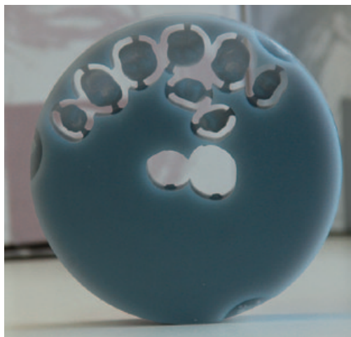
Рис. 5. Коронки, отфрезерованные из воска