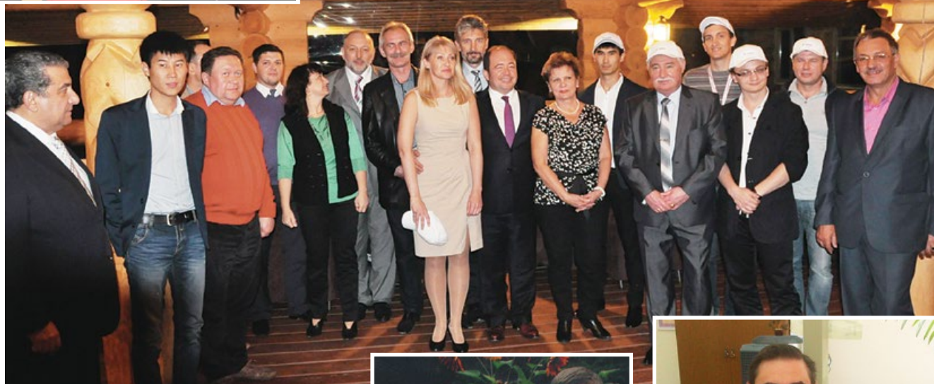
Рис. 8. Заключительный снимок участников, членов жюри и организаторов конкурса во Владивостоке