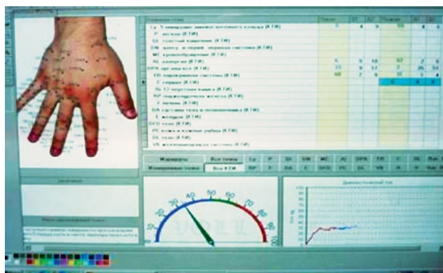
Рис. 3. Методика Фолля, проводимая с помощью ДиаДЭНС-ПК

В данном разделе настоящего исследования было проведено сравнение эффективности использования динамической электростимуляции (ДЭНС) при болях, возникающих после пломби-