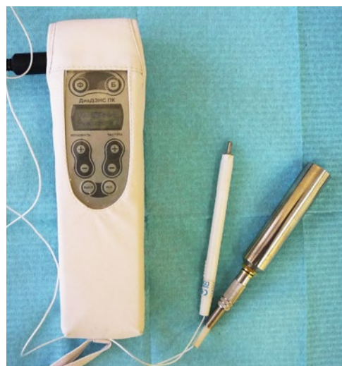
Рис. 2. Аппарат ДиаДЭНС-ПК