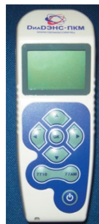
Рис. 1. Аппарат ДиаДЭНС-ПКМ

Пациенты, принявшие участие в исследовании, не имели никаких медицинских противопоказаний. Никакие другие формы физиотерапевтического лечения в период исследования не допускались. Субъекты не принимали участия ни в каких других клинических испытаниях во время проведения данного исследования. Все участники были обеспечены аппаратурой «ДиаДЭНС-ПКМ» (рис. 1), «ДиаДэНС-ПК» (рис. 2), комплектом учебно-методической литературы. Курс динамической электростимуляции состоял из 10 ежедневных процедур.