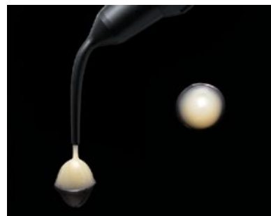
G-aenial Universal Flo