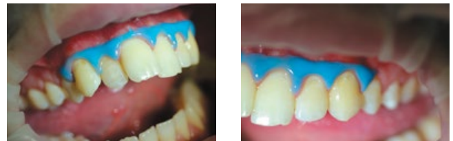
Рис. 4, 5. Зубы после промывания и высушивания