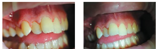
Рис. 8, 9. Вид зубов после полирования

щения в виде боли или гиперестезии. Поверхность зубов в зоне поражения стала плотной, гладкой, блестящей, дефекты тканей были устранены, эмаль имела естественный цвет. Данные критерии, а также положительный опыт наших трехлетних наблюдений за подобными клиническими случаями свидетельствуют о полноценном восстановлении функциональных и косметических характеристик зубов в результате лечения, с отсутствием рецидивов, что, в свою очередь, позволяет считать проведенное терапевтическое вмешательство эффективным.