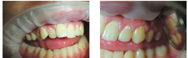
Рис. 1, 2. Сочетанное поражение кариесом в стадии меловидного пятна и поверхностного дефекта

Как в процессе работы, так и после завершения лечебной процедуры у пациента в области обработанных зубов отсутствовали субъективные ощу-