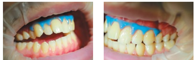
Рис. 6, 7. Дефекты после инфильтрации и пломбирования