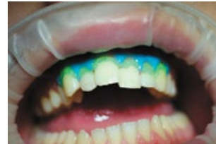
Рис. 3. Нанесенная кислота на зоны поражения