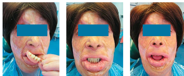
а б в Рис. 4. Внешний вид пациентки К. 62 лет (после протезирования): а – способ введения протеза (через здоровый угол рта), б – фиксация прикуса, в – проверка фиксации съемных протезов при широком открывании рта