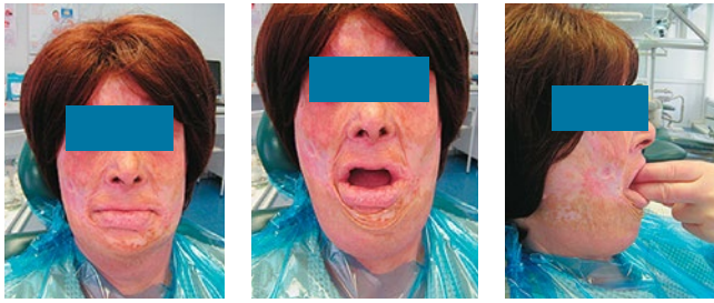
Рис. 1. Внешний вид пациентки К. 62 лет (на момент обращения). Степень открывания полости рта