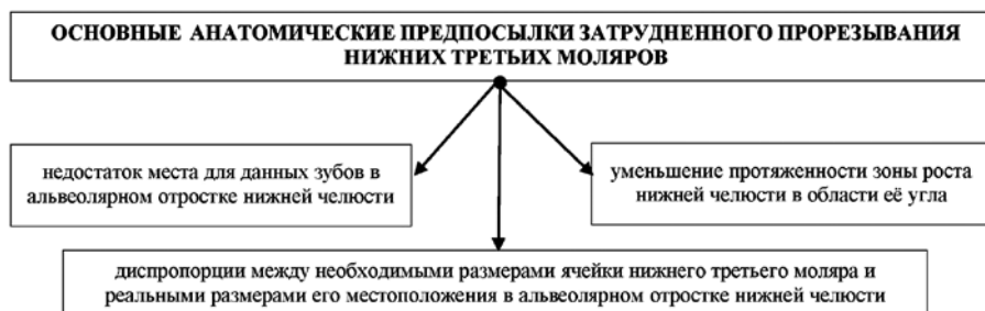
Рис. 1. Основные анатомические предпосылки затрудненного прорезывания нижних третьих моляров

Ключевые слова: ретенция восьмых зубов, зубочелюстные аномалии.