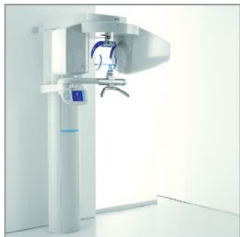
3D рентгенография от 57 000 Евро