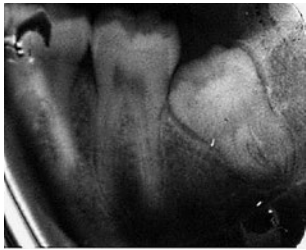
Рис. 4. Дистоция 3.8 зуба