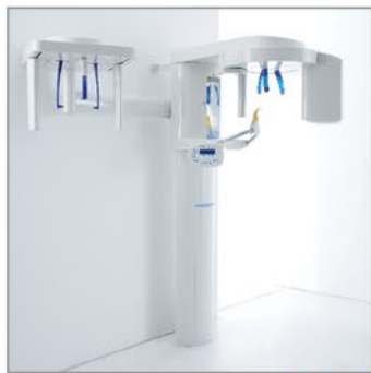
Ортопантомографы от 16 500 Евро