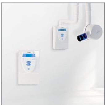
Комплекты радиовизиографии от 6 000 Евро