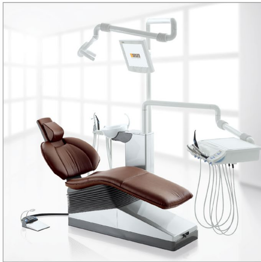
Стоматологические установки С8+ от 8 700 Евро

Комплектация с электрическим микромотором, LED светильником и стулом врача - 9 750 Евро