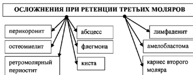
Рис. 3. Осложнения при ретенции третьих моляров

а – медиальный наклон; б – вертикальное положение; в – дистальный наклон; г – горизонтальное положение; д – инверсия; е – щечный наклон; ж – язычный наклон; з – буккверсия; и – лингвоверсия