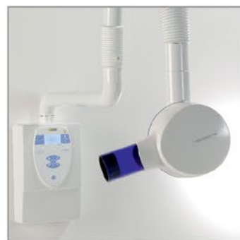
Мультиимпульсный интраоральный рентгеновский аппарат Heliodent Plus - 2 700 Евро

цены действительны на период проведения акции